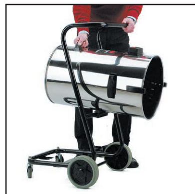
Fusto ribaltabile per scarico veloce di sporco e liquidi