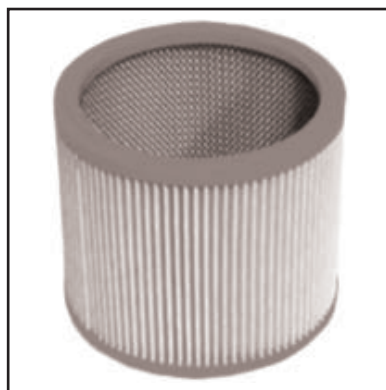
Filtro a cartuccia in poliestere lavabile