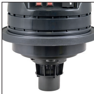
Sistema galleggiante con antischiuma