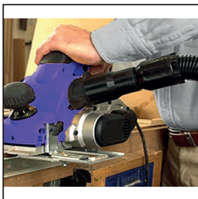
Dotato di presa elettrica 220 V per collegamento di elettrooutensili