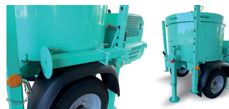
Piede per sollevamento macchina fornito di serie.