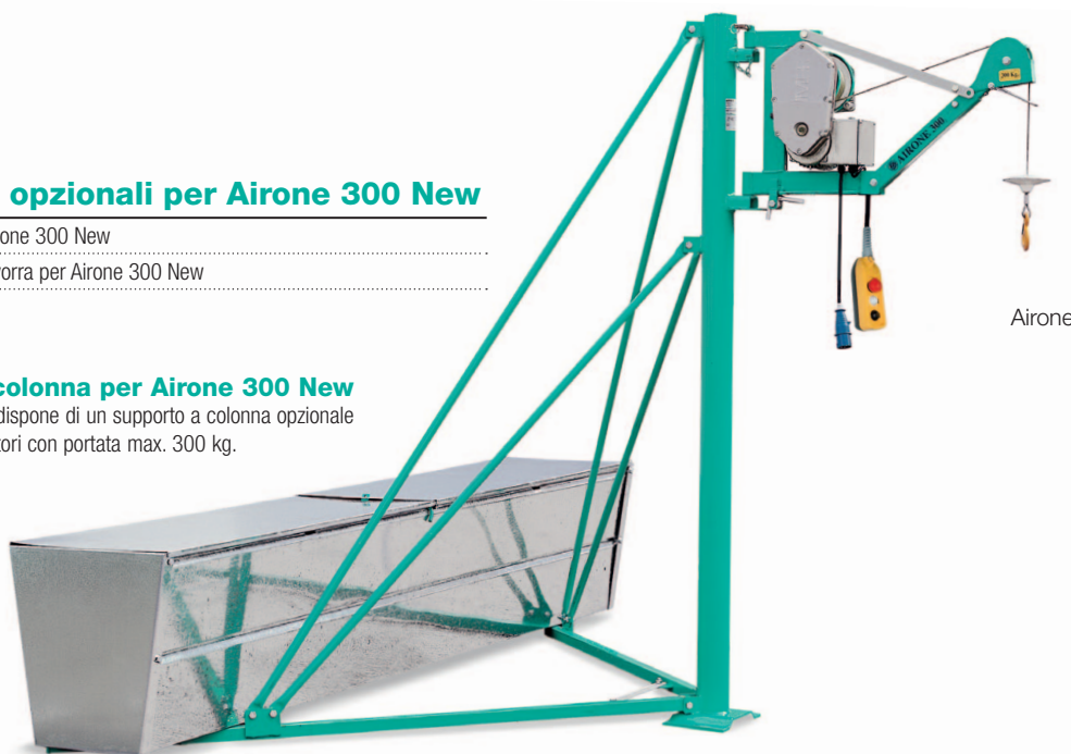
Airone 300 New

L'Airone 300 New dispone di un supporto a colonna opzionale specifico per elevatori con portata max. 300 kg.